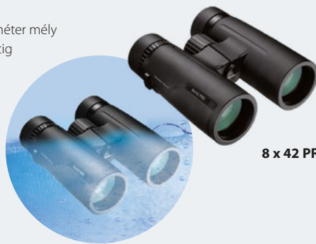
8 x 42 PRO