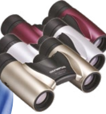
8x21 RC II Magenta Gyöngyházfehér Pezsgőszínű