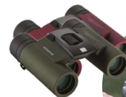
8x25 WP II Sötétlila Erdőzöld