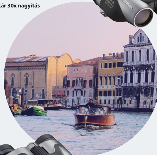
10-30x25 Zoom PC I