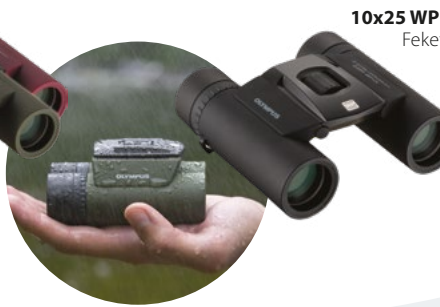
10x25 WP II Fekete