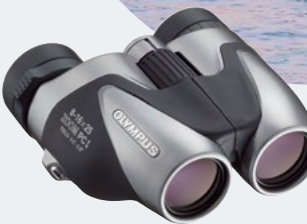
8-16x25 Zoom PC I