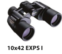
10x42 EXPS I