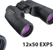
12x50 EXPS I