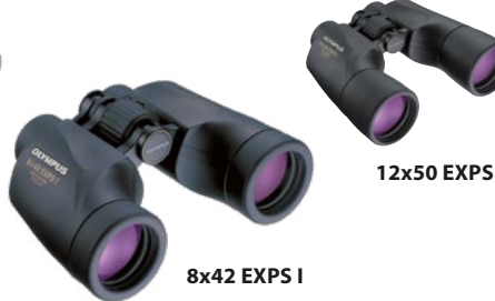
8x42 EXPS I