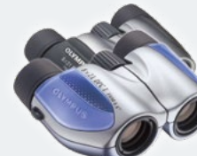
8x21 DPC I Ezüst Acélkék