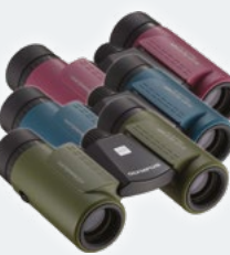
8x21 RC II WP Magenta Kék Olajzöld