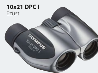
10x21 DPC I Ezüst